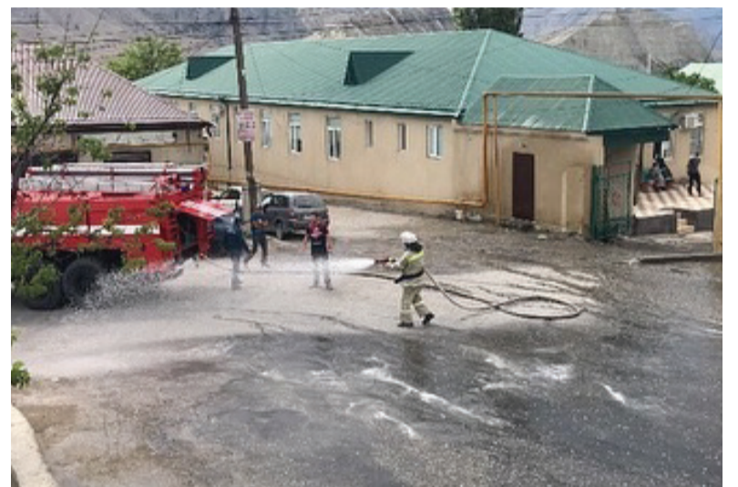
Суратазда: Дезинфекция гьабулеб