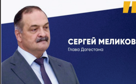
СЕРГЕЙ МЕЛИКОВ Глава Дагестана

Дополнительная выплата в 200 тысяч рублей будет осуществляться сразу после зачисления военнослужащего, заключившего контракт, в полк резерва