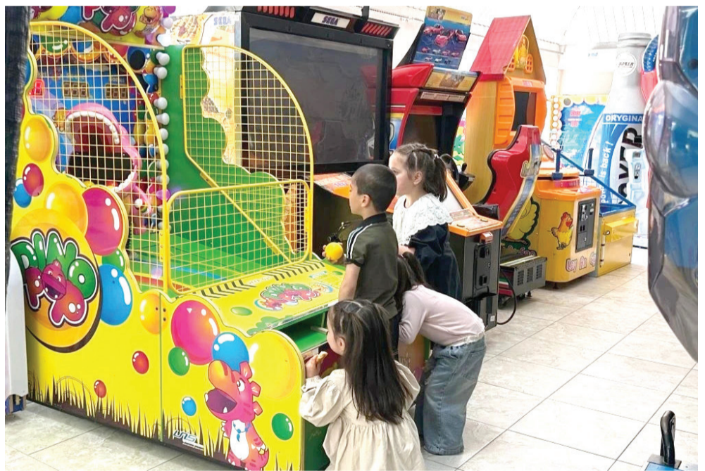
РоцIараб дунялги. ХъахИлаб зобги. Лъималазул релъиги - разилъиги, гъеб кинабго буго щибал лъималазул умумуз, лъималазе гъарулеб жо. «Лъимал гъечлеб гІумру, - бакъ гъечлеб рагIад», - ян аби буго умумузул.

Тлоцebeseb июналда лъимал цІуниялъул халкъазда гъоркъосеб къо кюдо гъабуна дунялалъул гIемерисел улкабазда . Халкъазда гъоркъосеб лъимал цІуниялъул къо. Гъеб тIобитІулеб буго 1950 соналдаса байбихъун . гъеб къоялда, тлоцebeseb иргаялда, чIахиязда цоги нухалда раклалде щвезарула лъималазулги ихтиярал рукІин.