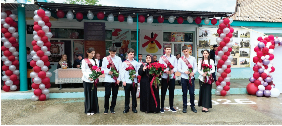
Байбихъи 1-аб. гъум.

Якъинаб буго, байрамалда би-шунго циклгун бербалагъи 11-леб классгун цалдохъабазе щолеблъи.